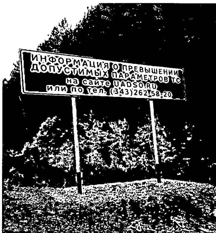
Вид «технического средства», с помощью которого информируется водитель о результатах измерений (сентябрь 2018 года)

По мнению грузоперевозчиков, перечисленное является недостаточным и даже недопустимым с точки зрения обеспечения безопасности дорожного движения, поскольку в силу технических причин (отсутствие доступа к информационно-телекоммуникационной сети «Интернет» и стабильной сотовой связи при передвижении транспортного средства) не позволяет водителю (собственнику) транспортного средства получить оперативную информацию о возможных превышениях допустимых параметров, а также не дает возможности своевременно устранить выявленные нарушения правил движения транспортного