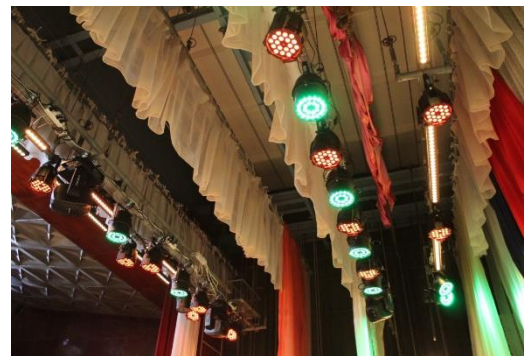
«Засветись» (замена светового оборудования сцены зрительного зала), городской округ Краснотурьинск