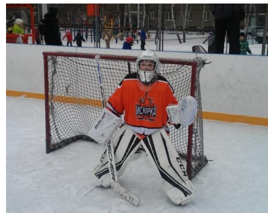
Оснащение оборудованием спортивной секции «Хоккей с шайбой», город Екатеринбург