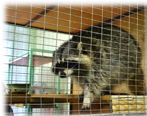
«Тактильный зоопарк» МБУДО «Станция юных натуралистов» Асбестовского городского округа