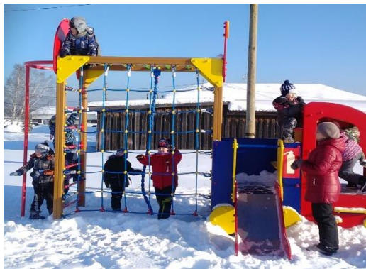
«Благоустройство территории для общественных мероприятий, в том числе детской площадки на территории Невьянской сельской администрации по адресу: с. Невьянское, пер. Молодежный, 5», Муниципальное образование Алапаевское