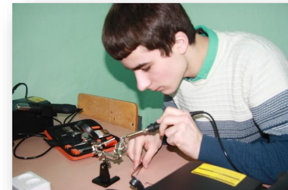
«Создание и оснащение технической лаборатории «Радиотехника» («От Технолаба к Технопарку») (городской округ Карпинск)