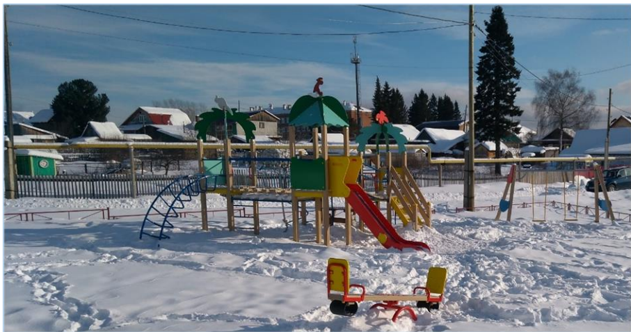
«Обустройство детской площадки, расположенной по адресу: пос. Валериановск, ул. Горняков, в районе д. 17», Качканарский городской округ